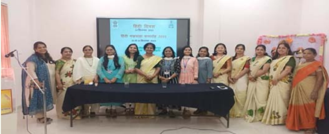
हिंदी पखवाड़ा समारोह (आरएमसी नागपुर) 1-14, सितंबर, 2023