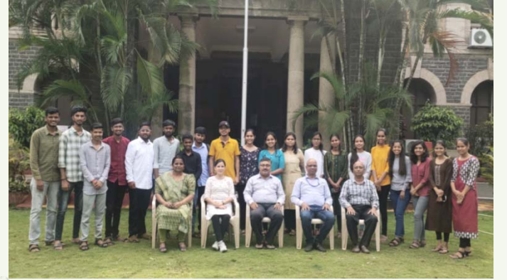
बी. टेक (कृषि इंजीनियरिंग) के छात्र

एग्रीमेट डिवीजन, आईएमडी, पुणे द्वारा 4-28 सितंबर, 2023 के दौरान बी. टेक (कृषि इंजीनियरिंग) के छात्रों के लिए चार सप्ताह का ग्रीष्मकालीन प्लेसमेंट पाठ्यक्रम आयोजित किया गया।