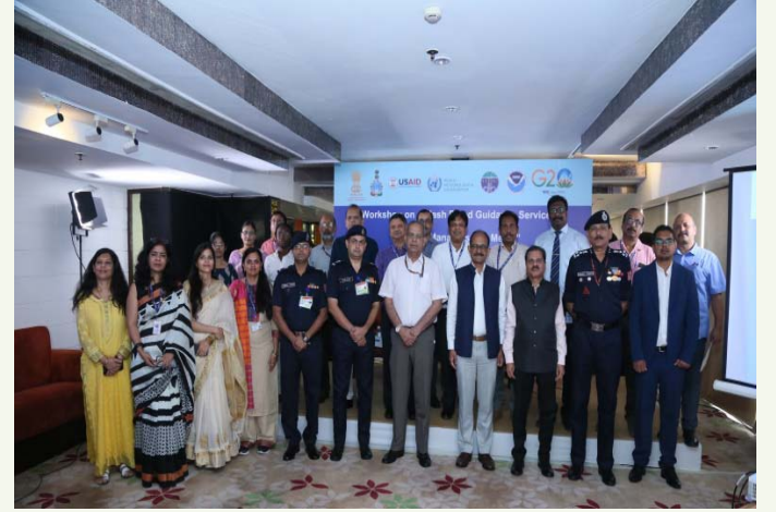
9 अगस्त, 2023 को दिल्ली में आकस्मिक बाढ़ मार्गदर्शन सेवाओं पर आपदा प्रबंधकों और मीडिया के लिए जागरूकता कार्यक्रम

आईएमडी ने दोनों संस्थानों के बीच अनुसंधान और विकास को बढ़ावा देने के लिए 12 अगस्त, 2023 को शिक्षा 'ओ' अनुसंधान डीम्ड यूनिवर्सिटी, भुवनेश्वर के साथ एक समझौता ज्ञापन पर हस्ताक्षर किए।