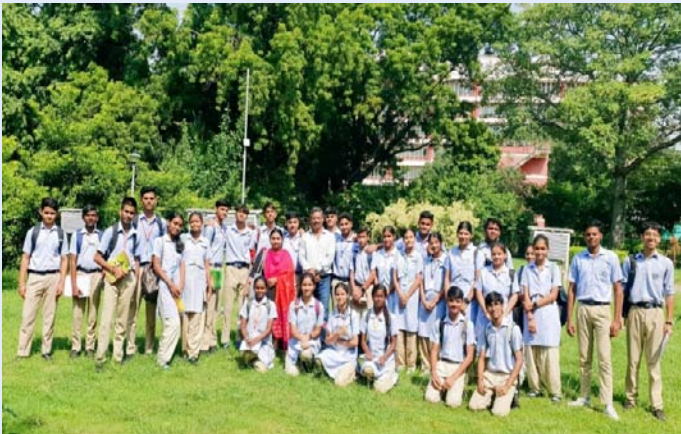
ईस्ट पॉइंट स्कूल, वसुंधरा एन्क्लेव