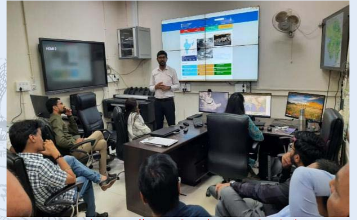
गुजरात इंस्टीट्यूट ऑफ़ के प्रशिक्षुओं (राज्य अधिकारियों) का एक समूह आपदा प्रबंधन