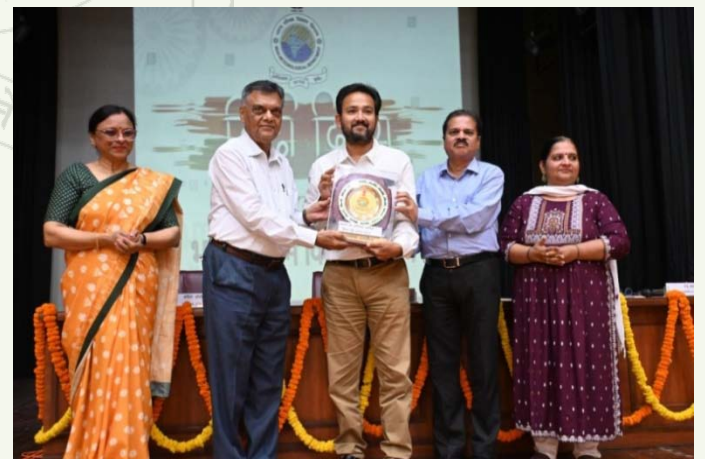
'राजभाषा चलशील्ड' प्रदान करते हुए

मुख्यालय में हिंदी दिवस समारोह दिनांक 26 सितम्बर, 2023 के अवसर पर राजभाषा हिंदी में सर्वश्रेष्ठ कार्य करने हेतु 'सूचना का अधिकार प्रकोष्ठ' को वर्ष 2022-2023 के लिए 'राजभाषा चलशील्ड' प्रदान की गई।