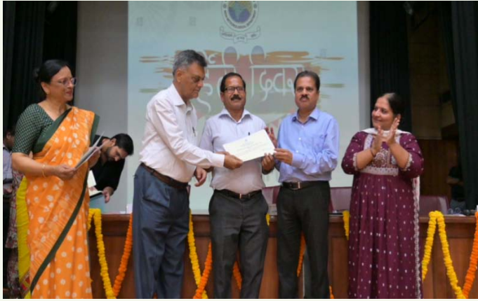
प्रोत्साहन योजना के अंतर्गत महानिदेशक महोदय द्वारा हिंदी दिवस के अवसर पर मुख्यालय में कार्यरत कार्मिकों को प्रमाण-पत्र प्रदान किए गए