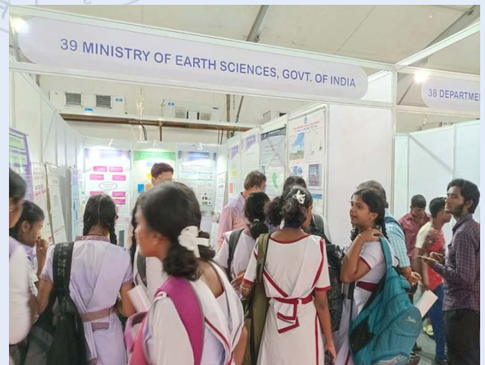
24-27 अगस्त, 2023 तक 26 वीं राष्ट्रीय विज्ञान प्रदर्शनी के दौरान एमओईएस स्टॉल का दौरा करते छात्र और अन्य आगंतुक

पृथ्वी विज्ञान मंत्रालय की ओर से, प्रादेशिक मौसम केंद्र कोलकाता के अधिकारियों और कर्मचारियों ने युवाओं के लिए केंद्रीय कलकत्ता विज्ञान और संस्कृति संगठन, 'आनंद भवन' द्वारा आयोजित, 24-27 अगस्त, 2023 तक सेंट्रल पार्क मैदान, कोलकाता में 'आगे बढ़ने, शक्तिशाली और महान भारत बनाने में योगदान' विषय पर 26 वीं राष्ट्रीय विज्ञान प्रदर्शनी में भाग लिया। विभिन्न मौसम संबंधी उपकरण, चार्ट, एमओईएस फ्लेक्स प्रदर्शित किए गए तथा मौसम संबंधी अवलोकन और मौसम पूर्वानुमान के लिए इसके महत्व के बारे में जानकारी दी गई।