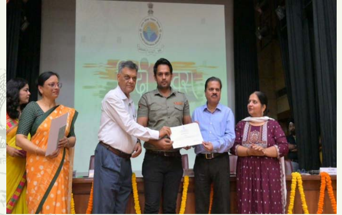
महानिदेशक महोदय द्वारा हिंदी दिवस के अवसर पर विजयी प्रतियोगी को पुरस्कार प्रदान किए गए