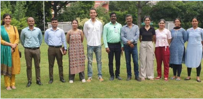
भारतीय तटरक्षक, भारतीय नौसेना और प्रशिक्षु मॉरीशस मौसम विभाग से

ईस्ट पॉइंट स्कूल, वसुंधरा एन्क्लेव, संस्कृति स्कूल, चाणक्यपुरी, नई दिल्ली के छात्रों, भारतीय तटरक्षक, भारतीय नौसेना और मॉरीशस मौसम विज्ञान विभाग के प्रशिक्षुओं, एफटीसी प्रशिक्षण बैच नंबर के प्रशिक्षुओं सहित लगभग 111 आगंतुक। 196 और दयाल सिंह कॉलेज के छात्रों ने 1 जुलाई, 2023 से 30 सितंबर, 2023 तक सेंट्रल हाइड्रोमेट वेधशाला का दौरा किया।