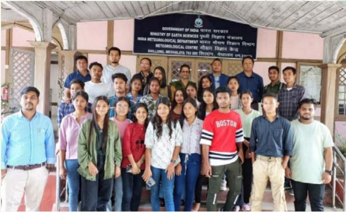
छात्र और शिक्षक, भूगोल विभाग, मोरी गांव कॉलेज ने एमसी शिलांग का दौरा किया

20 छात्र और 2 शिक्षक, भूगोल विभाग, मोरी गांव कॉलेज ने 29 सितंबर, 2023 को एमसी शिलांग का दौरा किया।