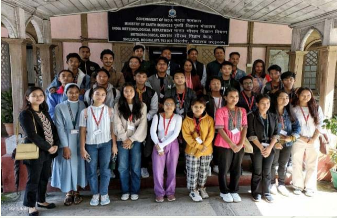
यूसीसी बारापानी कॉलेज के छात्र और शिक्षक ने एमसी शिलांग का दौरा किया

यूसीसी बारापानी कॉलेज के भौतिकी विभाग के 22 छात्र और 4 शिक्षक 22 सितंबर, 2023 को एमसी शिलांग का दौरा किया।