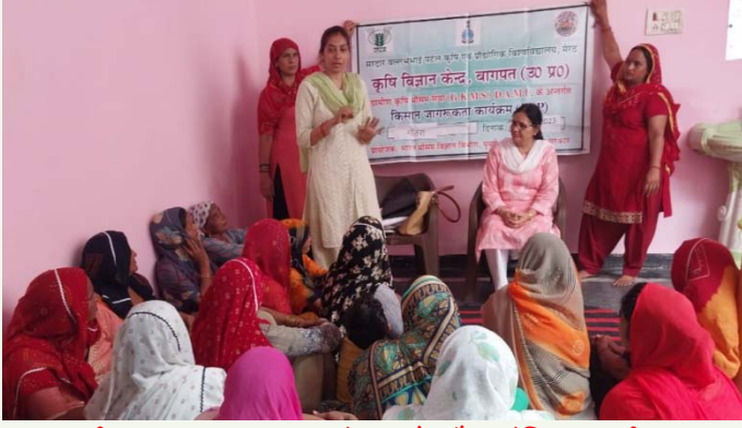
डीएएमयू, बागपत द्वारा गोथरा गांव में आयोजित एफएपी, 19 जुलाई 2023 को बागपत जिला, उत्तर प्रदेश