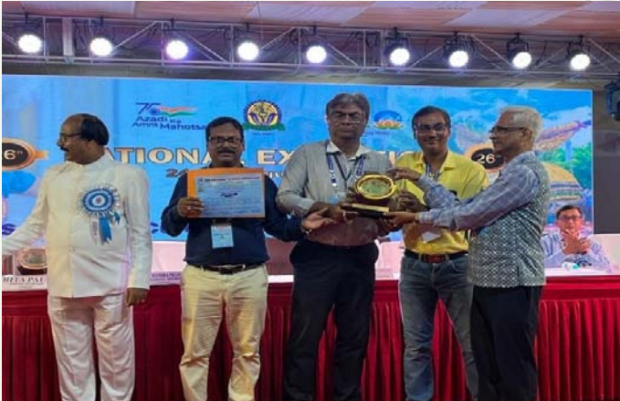
एमओईएस की ओर से आईएमडी (आरएमसी कोलकाता) के अधिकारी 26 वाँ राष्ट्रीय विज्ञान प्रदर्शनी में भाग लेने के लिए प्रमाण पत्र और स्मृति चिन्ह प्राप्त करते हुए