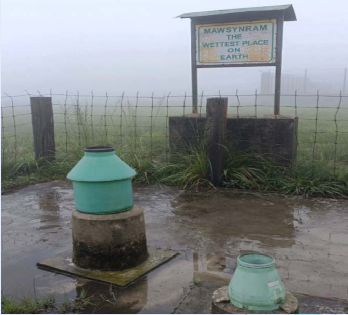
मावसिनराम में विश्व के सबसे अधिक वर्षा वाले स्थान के लिए नए AWS का प्रस्ताव रखा गया था

मावसिनराम में विश्व के सबसे अधिक वर्षा वाले स्थान के लिए नए AWS का प्रस्ताव रखा गया। परियोजना को 4 अगस्त, 2023 को साइट चयन पूरा होने और डीडीएमए ईस्ट खासीहिल्स से एनओसी प्राप्त होने के साथ प्रमुख, आरएमसी गुवाहाटी द्वारा अनुमोदित किया गया।