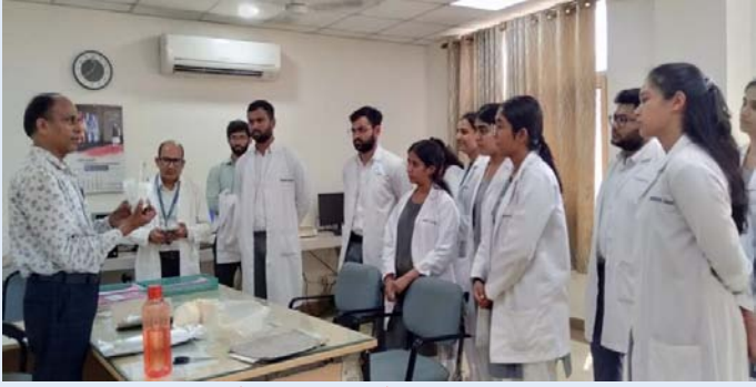
विभिन्न महाविद्यालयों के विद्यार्थियों ने एमसी देहरादून का भ्रमण किया

एनईआरएलडीसी के अधिकारियों ने पूर्वोत्तर क्षेत्र के विभिन्न स्टेशनों पर एडब्ल्यूएस/एआरजी की स्थापना से संबंधित बैठक के लिए 12 सितंबर, 2023 को आरएमसी गुवाहाटी कार्यालय का दौरा किया।