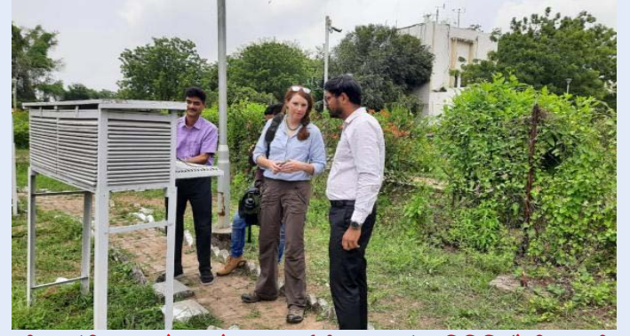
राष्ट्रीय मलेरिया अनुसंधान संस्थान (आईसीएमआर) के प्रतिनिधियों की एक टीम

राष्ट्रीय मलेरिया अनुसंधान संस्थान (आईसीएमआर) के प्रतिनिधियों की एक टीम और गुजरात आपदा प्रबंधन संस्थान (जीआईडीएम) के प्रशिक्षुओं (राज्य अधिकारियों) के एक समूह ने दिनांक 29 अगस्त, 2023 को मौसम केंद्र, अहमदाबाद का दौरा किया।