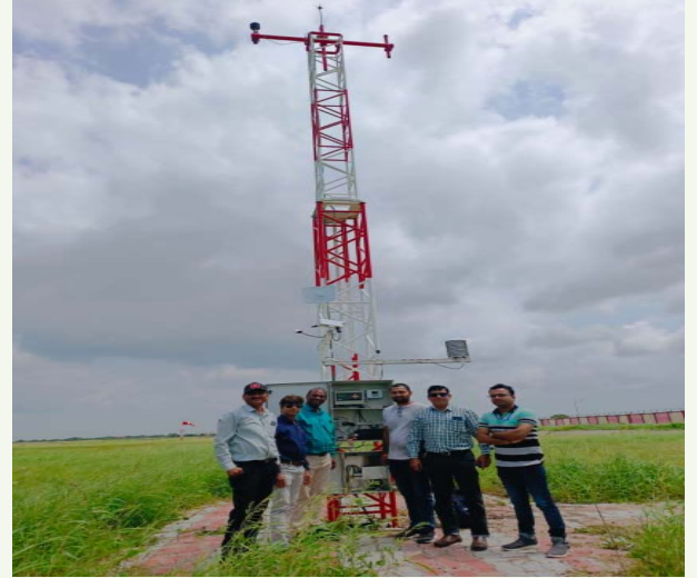
वडोदरा में पी. डब्ल्यू. डी

सितंबर : कूचबिहार (आरडब्ल्यूवाई 22); वडोदरा (आरडब्ल्यूवाई 22); झारसुगुड़ा (RWY 24)